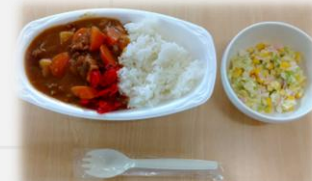
※写真は昼食イメージです。