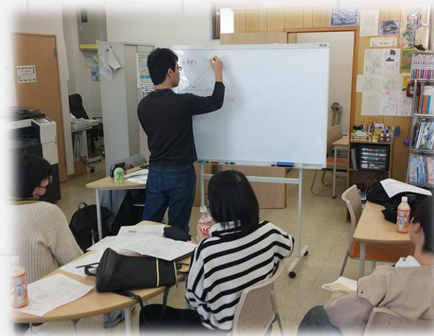
普段の勉強の様子