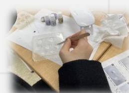
※写真はレジン工作です。